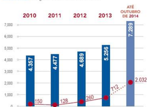
GRÁFICO 02 Refugiados reconhecidos no Brasil